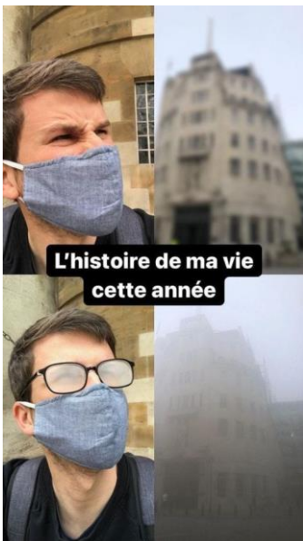
L'histoire de ma vie cette année