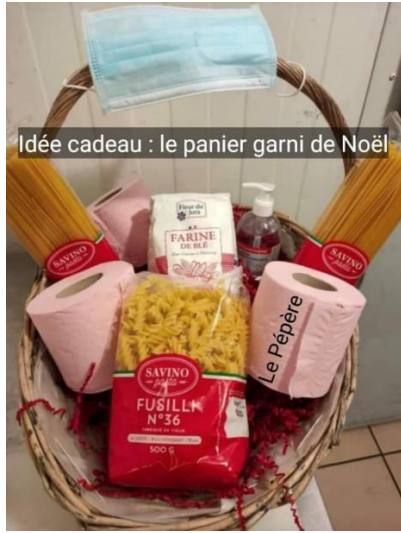
Idée cadeau : le panier garni de Noël

Ma femme m'a dit : "Voici 30 €. Trouve nous une crèche pour Noël. S'il reste des sous, tu peux t'acheter de la bière".