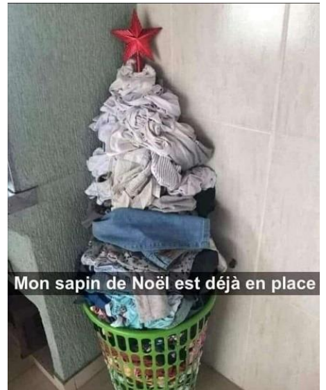
Mon sapin de Noël est déjà en place

L'ERREUR A ÉTÉ D'APPELER LE VIRUS CORONA. SI ON L'AVAIT APPELÉ PSG IL SERAIT DÉJÀ ÉLIMINÉ 😂😂😂